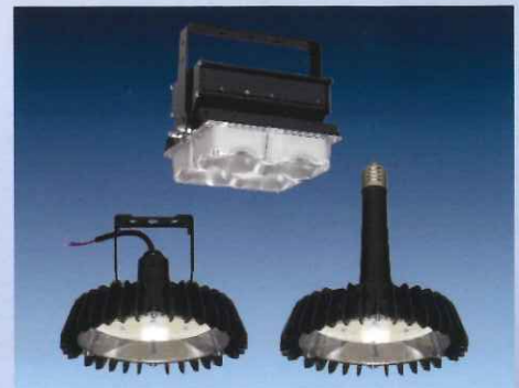
LED照明 (高天井用LED、製品例)