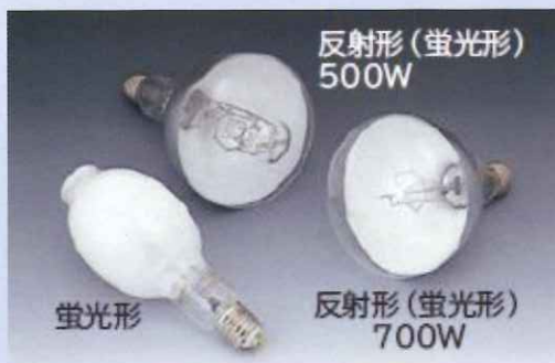
水銀ランプ (製品例)