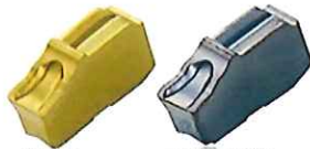
勝手なし 右勝手/左勝手 GM プレーカ