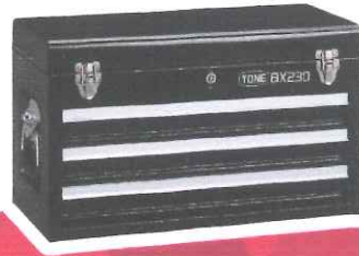
■ BX230 ケース寸法