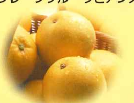
グレープフルーツ