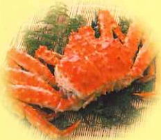
カニ(キチンキトサン)

マスク・歯ブラシ・ハンカチ・衣服・ドアノブ・テーブル・食器・まな板・空間・トイレ等に!