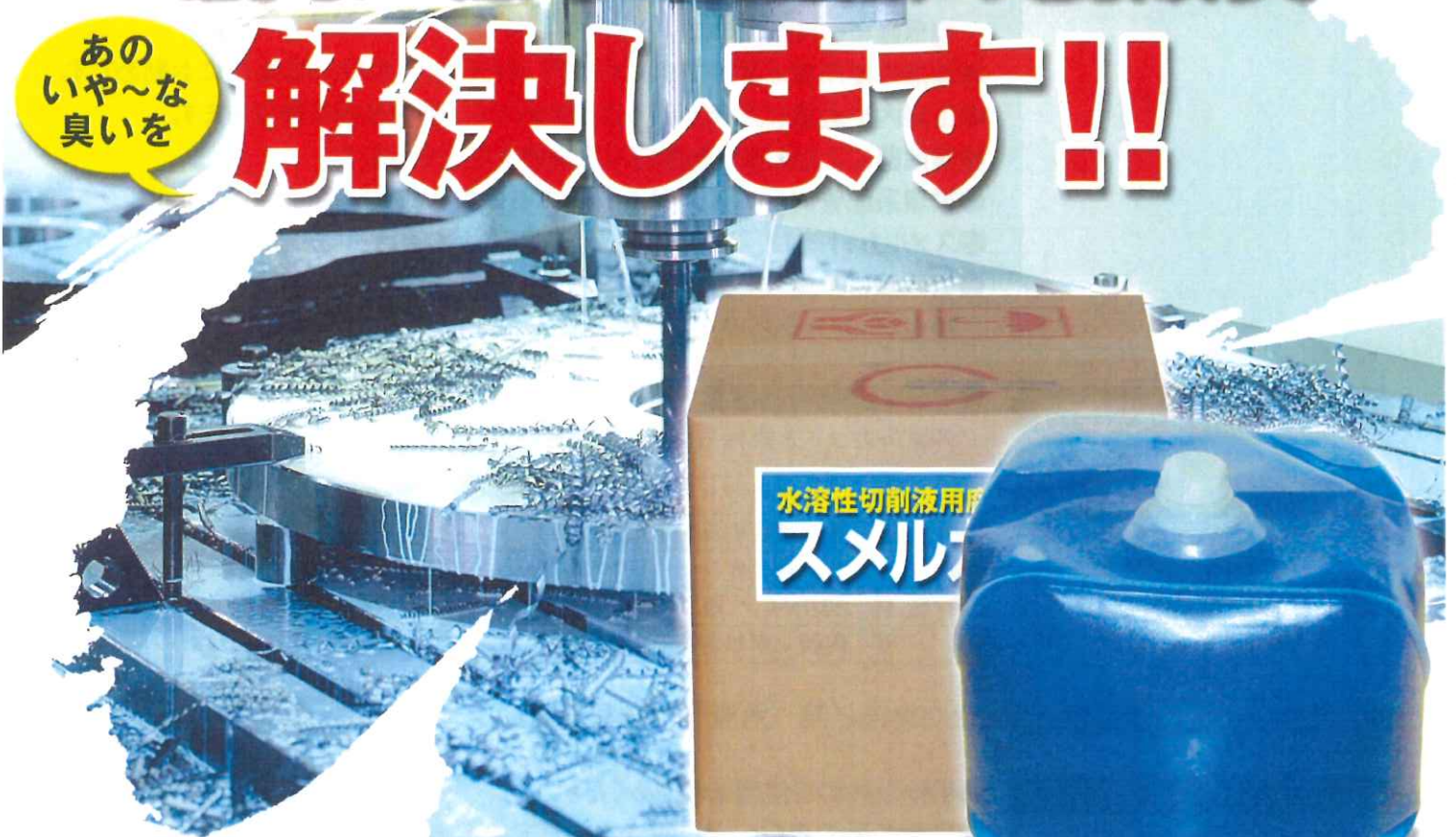
スメルカット20リットル入り