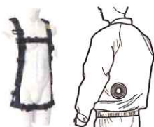
■体と保冷剤の接点温度