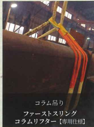
コラム吊り ファーストスリング コラムリフター【専用仕様】