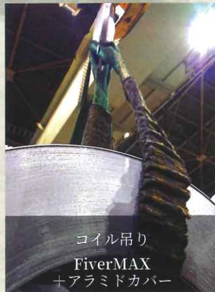
コイル吊り FiverMAX +アラミドカバー