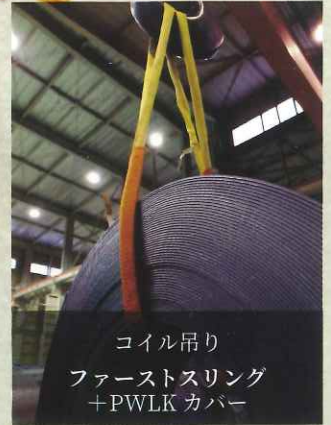
コイル吊り ファーストスリング +PWLKカバー