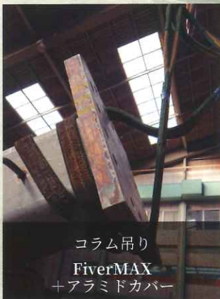
コラム吊り FiverMAX +アラミドカバー

従来の重たいポリエステルスリング・ワイヤ・チェーン等から、当社製品へ切り替えをされた事例をお届けします。