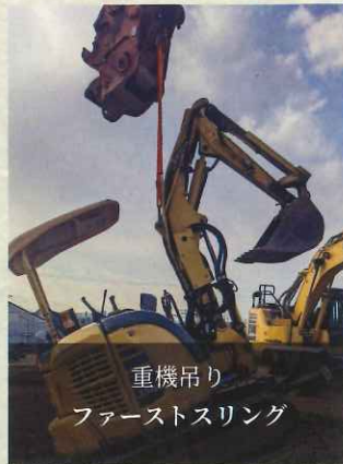
重機吊り ファーストスリング