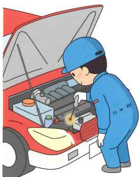
自動車などのメンテナンス