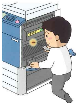
精密機械のメンテナンス

ホールライトは通常のライトと異なり光の届きにくい場所を照らします。 工具箱に1つあれば大変便利なライトです！