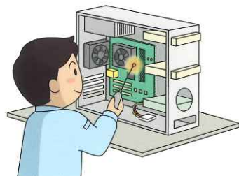
パソコンなどのメンテナンス