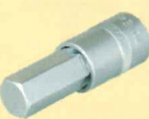
ヘキサゴンソケット