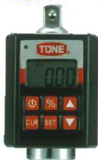
ハンディデジタルトルク

目標トルクに近づくとブザー音 (断続)でお知らせ。 目標トルクの50%~95%の範囲 でブザー開始を設定可能。