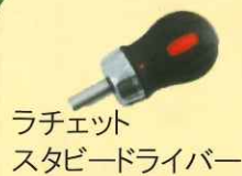
ラチェット スタビードライバー