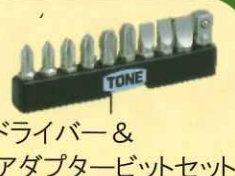
ドライバー & アダプタービットセット