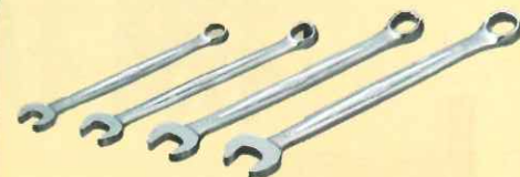
コンビネーションスパナ

ラチェットスタビードライバーで楽々作業! トルクスビット11サイズ、 ドライバー&アダプタービット 各種で多様な作業が実現!