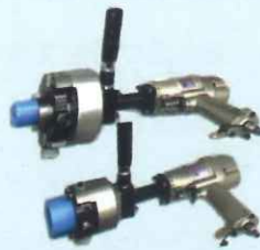
サイドギア用刻印機

自動車に使われるドライブギア・トランス ファーギア・スパイダー・ドライブシャフト・ ドライブギア等に合わせたオーダーメイド。